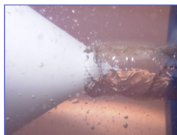
Implosion de l'eau à la sortie de la spirale et création du vortex

L'eau continue ensuite de circuler en tourbillonnant sur elle-même dans toute la canalisation, reproduisant le mouvement centripète naturel produit par son parcours dans les rivières.