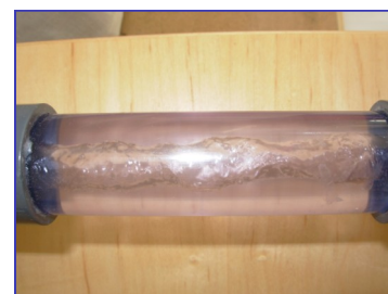
Circulation de l'eau de manière centripète dans toute la canalisation